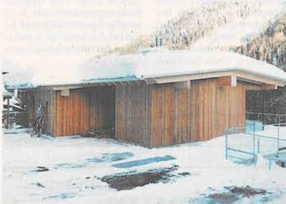
Der Eingangsbereich des Hauses im Norden lässt keine Einblicke zu und Besucher nicht erahnen, welcher Ausblick sie erwartet.