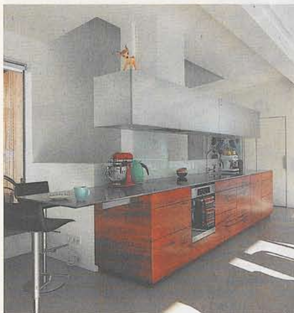
Der holzverkleidete Küchenblock mit schwebendem Oberboard und die Einrichtung des offenen Wohnbereichs mit Sicht auf die Berge wurden von Vivian Boje entworfen.