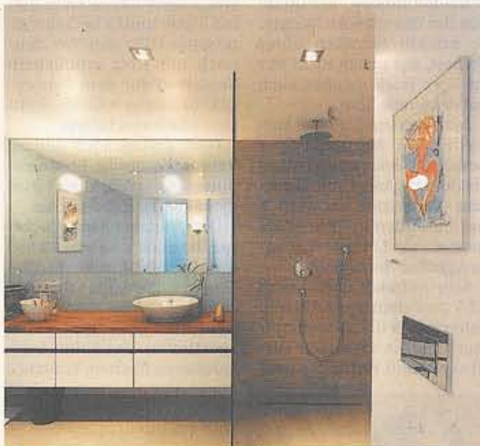
Das Badezimmer besticht durch helle Farben und schlichte Eleganz.