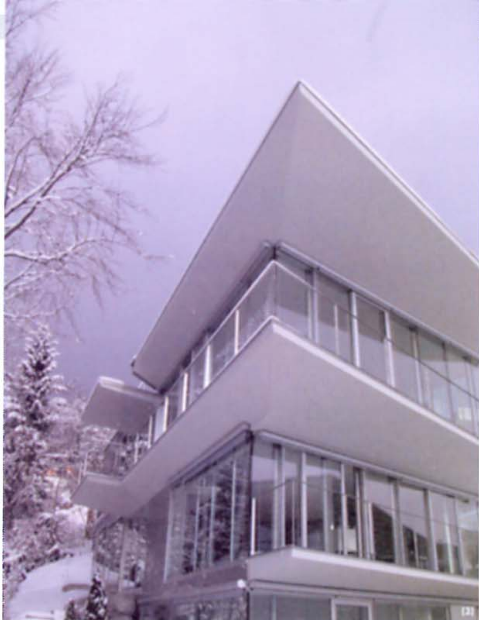
(1-3) Villa F, Innsbruck