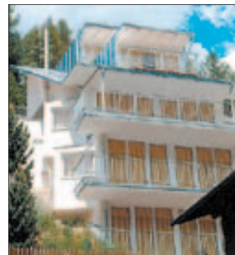
Villa Chiara in St. Anton a. A.

einer Größe von 267 Quadratmeter und einer Hanglage von zirka 35 Grad galt dieses bis zum Jahr 2001 als unbebaubar – entstand die Villa Chiara in St. Anton am