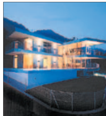
Villa K. in Innsbruck.

Auf dem kleinsten Baugrundstück Tirols – mit